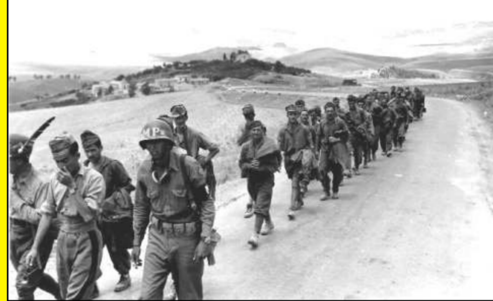
Soldati americani lasciano Ravanusa e vanno verso Caltanissetta

lasciarono il paese con le loro moto e presero la strada verso Riesi dove organizzarono una resistenza.