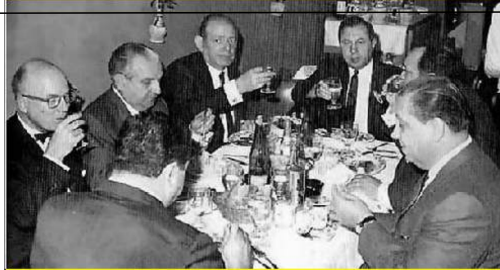
Carlos Marcello con Santo Trafficante e Frank Ragano